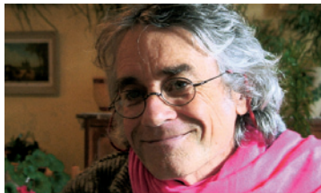
Dominique Guillet (Frankreich) Gründer des Vereins Kokopelli