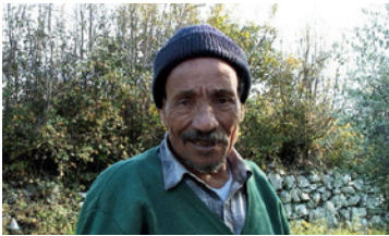
Pierre Rabhi (Marokko) Agroökologe & Schriftsteller