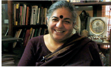
Vandana Shiva (Indien) Physikerin & Doktorin der Wissenschaftsphilosophie, alternativer Nobelpreis 1993